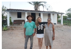
Mijn huis en mijn ouders.

Ik ben lid van de groep vrouwen, die onder directie van Novo Horizonte in Lagoa da Arara huishoudzeep maakt van gebruikte bakolie. Ik ben secretaresse van die groep. Ik ben ook betrokken bij de plaatselijke kerk als catecheet en ik ben lid van het koor. Ik ben de jongste van 10 kinderen en de enige die nog bij haar ouders woont. Mijn andere broers en zussen hebben allemaal hun eigen leven. Een van hen woont in São Paulo, de anderen wonen hier in de buurt. Zoals ik al schreef ben ik echt van plan mijn studie met succes af te ronden.